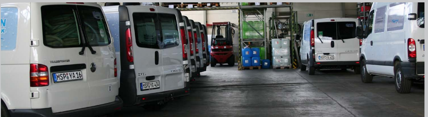
Unsere Serviceteams sind bundesweit unterwegs.