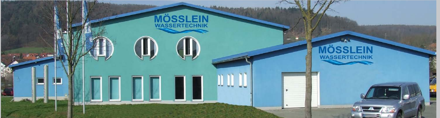
Verwaltungszentrale von Mösslein Wassertechnik in Lohr am Main