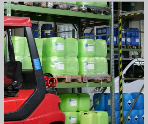
Service- und Logistikzentrale von Mösslein Wassertechnik in Lohr am Main